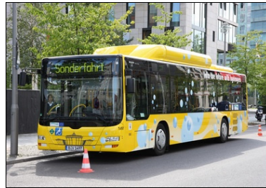
Shuttle-Service mit Wasserstoffbus der Berliner Verkehrsbetriebe