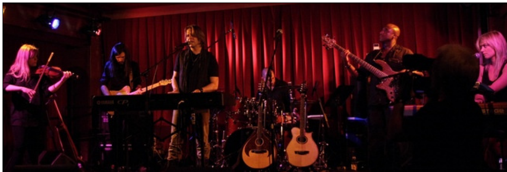
After-Show-Konzert von Clark Datchler (3. v. l.) mit Band am 21. August 2008 im Roten Salon der Volksbühne, Berlin