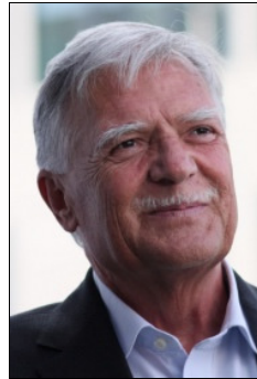
Michael Ballhaus Director of Photography CTMA Kultur & Medien