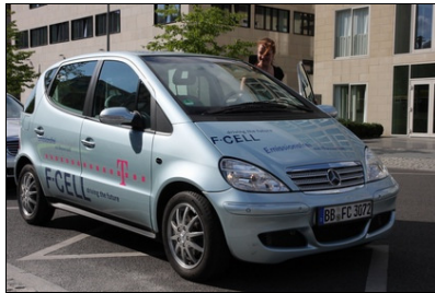
DAIMLER F-CELL Brennstoffzellenfahrzeug vor der Landesvertretung Brandenburg