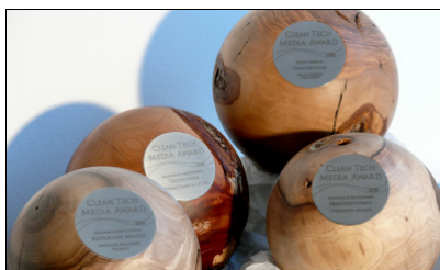
Holzkugeln des Künstlers Peter Wagensonner

Weitere Presseinformationen zum Clean Tech Media Award sowie zusätzliche druckfähige Bilder von der Verleihung finden Sie unter www.cleantech-award.de im Menüpunkt „Presse“ und bei „Fotos der Veranstaltung“.