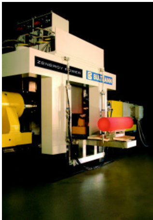
Induktionsheizer der Zenergy Power GmbH, Rheinbach, und der Bültmann GmbH, Neuenrade

Im März dieses Jahres folgte ein weiterer Auftrag für supraleitende Induktionsheizer von Zenergy Power und Bültmann. Der Industriekunde aus dem Buntmetallbereich möchte die Erwärmungsanlage in einem neuen Presswerk einsetzen und erwartet massive Kosten-, Umwelt- und Produktivitätsvorteile durch die Supraleitertechnologie.